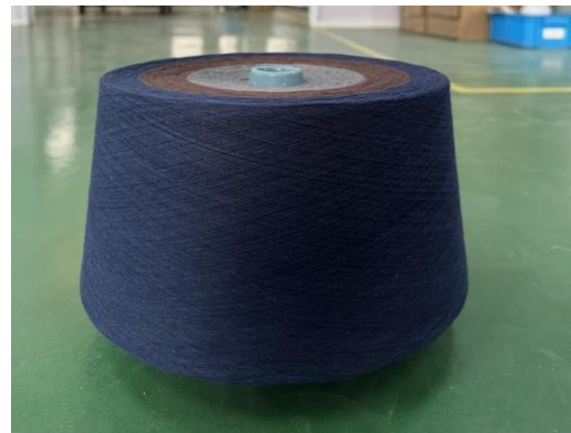
6ポンドパッケージ