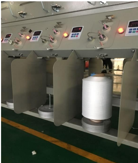
定量管理用電子はかり