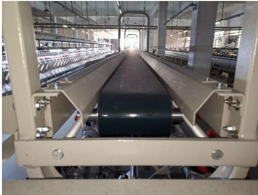
パッケージ搬送装置